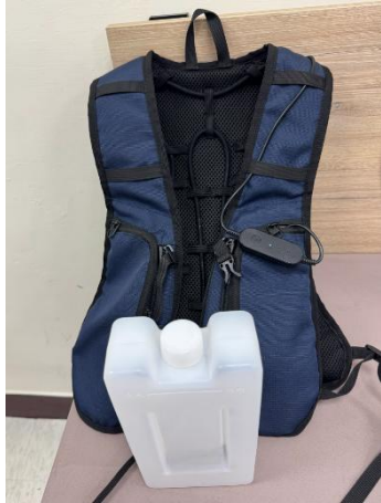
圖 8 水冷循環式背心

於實施勞工作業管理或現場設置降溫設備確有困難，無法有效降低勞工承受之熱壓力時，再考量選用適當之個人防護器具或用品，包含抗 UV 袖套、頭巾、寬簷帽、濕衣物、冰背心、具水冷循環式（圖 8）或配有風扇之背心（圖 9）等。但均應考量防護器具或用品造成之額外熱壓力影響。