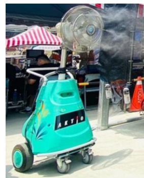
圖 5 運用噴霧電扇降溫