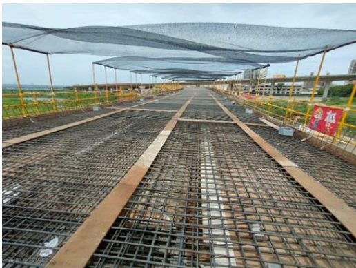
圖 2 架設遮陽網