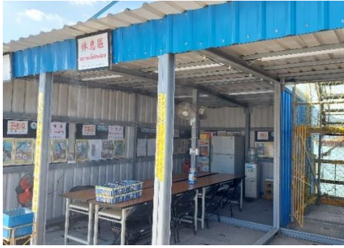
圖 6 設置遮陽及具備風扇、水霧之休息場所