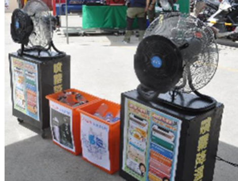
圖 7 休息場所提供風扇、充足飲用水或含電解質飲料