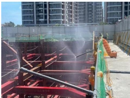
圖 4 運用灑水、水霧並可搭配鼓風機送風進行降溫