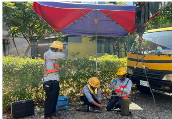
圖 3 設置遮陽棚、傘