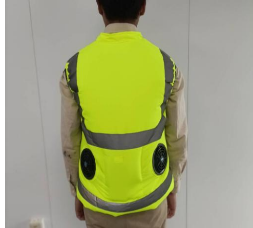
圖 9 配有風扇之背心